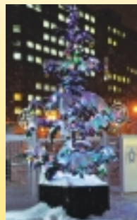
クリスマスデコレーションツリー