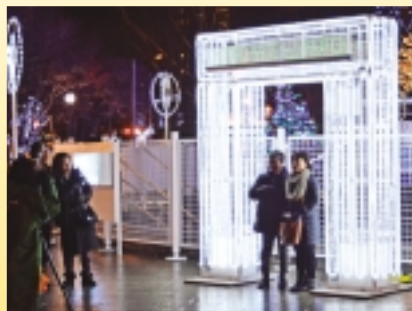
イルミネーションゲート