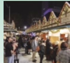
【協賛行事】 第13回 ミュンヘン・クリスマス市 in Sapporo