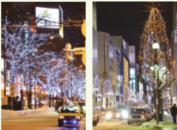
駅前通り会場・南一条通り会場