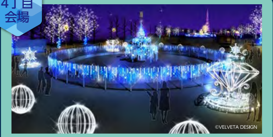
Spark Fountain (スパーク ファウンテン)