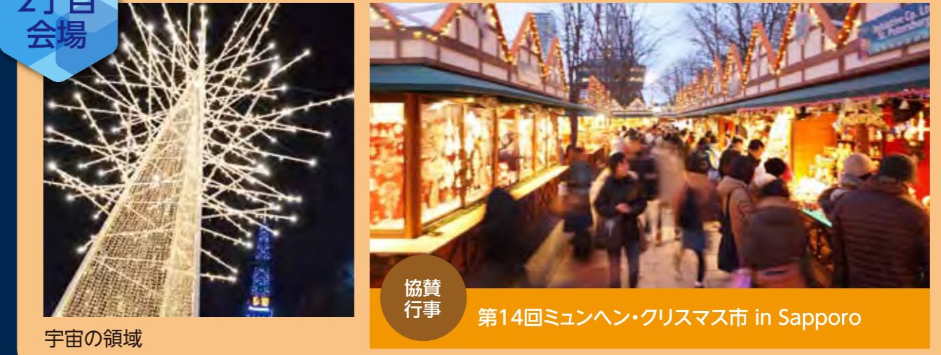
宇宙の領域 協賛行事 第14回ミュンヘン・クリスマス市 in Sapporo