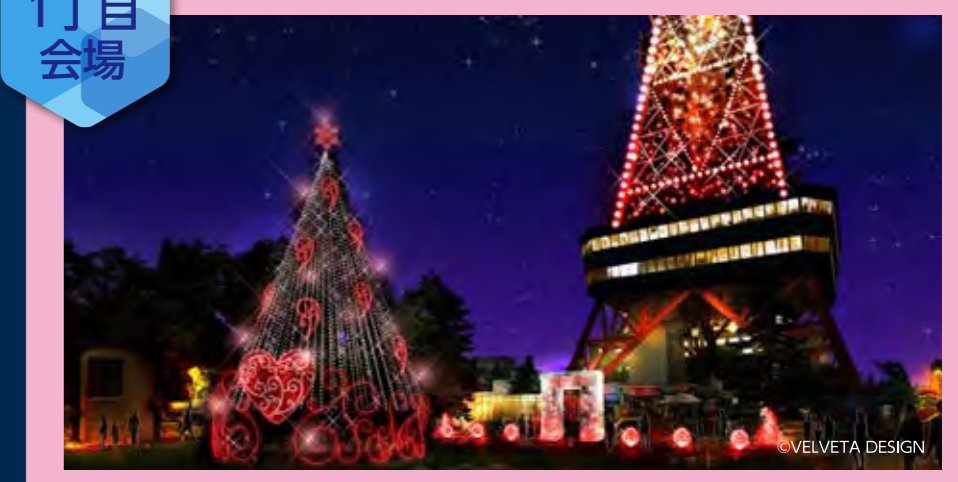
LOVE Tree (ラブ ツリー)