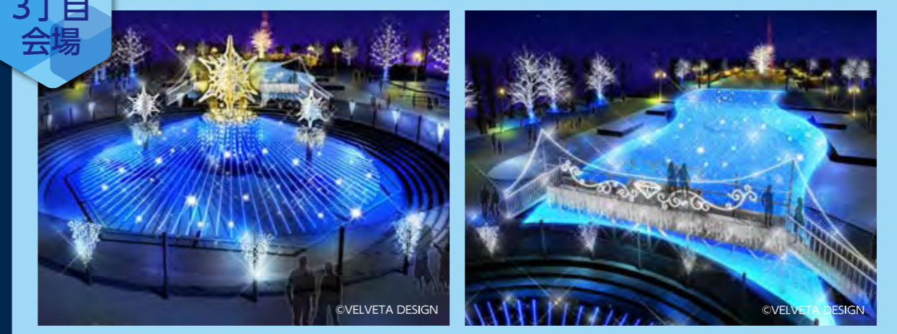
Snow Crystal (スノー クリスタル) きらめきの橋/クリスタル・リバー